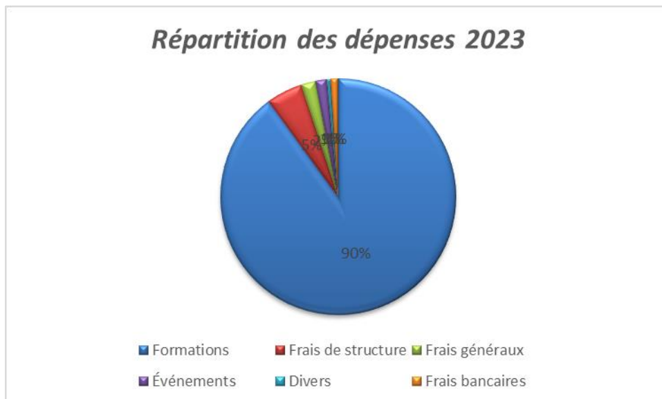
Graphique : Répartition des dépenses 2023 par poste.

comme le montre le graphique, mais additionnées elles complètent utilement le financement global. Cette visualisation aide à mieux appréhender la dépendance actuelle d’OPSYCOURS à quelques grands pourvoyeurs de fonds, tout en soulignant la diversité des apports.